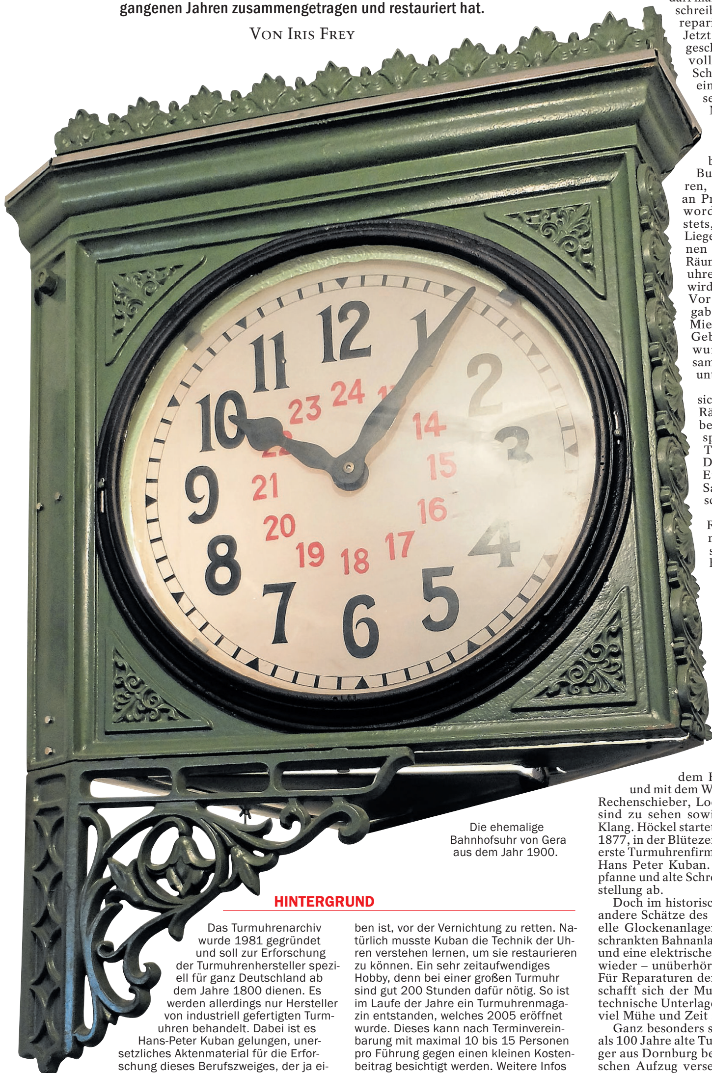
Die ehemalige Bahnhofsuhr von Gera aus dem Jahr 1900.